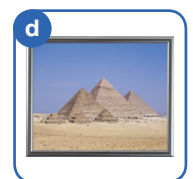
エジプトの しゃしん