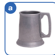
マレーシアの カップ