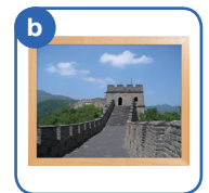
ちゅうごくの しゃしん