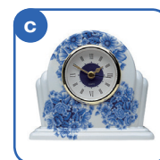
フランスの とけい